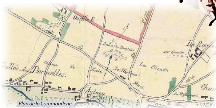
Plan de la Commanderie