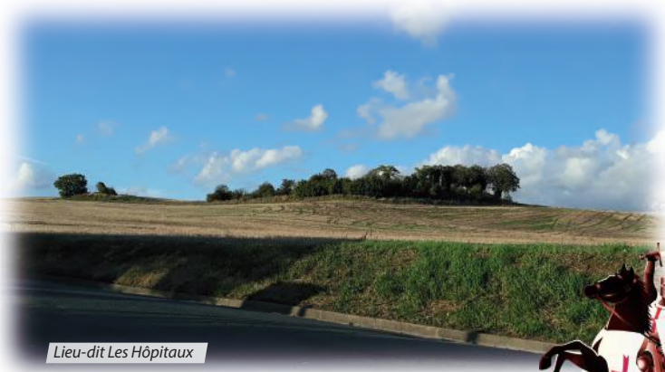
Lieu-dit Les Hôpitaux